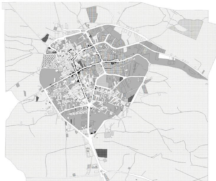
شکل ۳: نقشه شهر سرعین

بر اساس اطلاعات سازمان میراث فرهنگی و گردشگری استان اردبیل در سال ۱۳۸۵-۱۳۸۸ بیش از ۷۱ درصد گردشگران شهر سرعین جهت بازدید و استفاده از