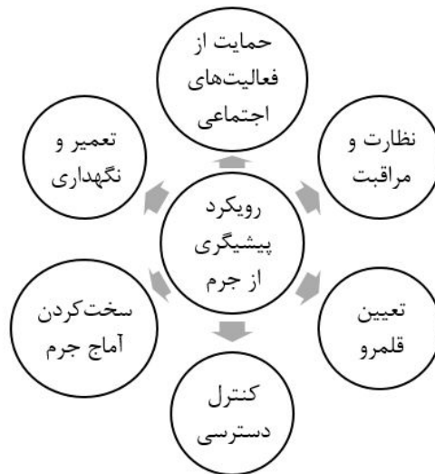
شکل ۳: نظریه پیشگیری از جرم