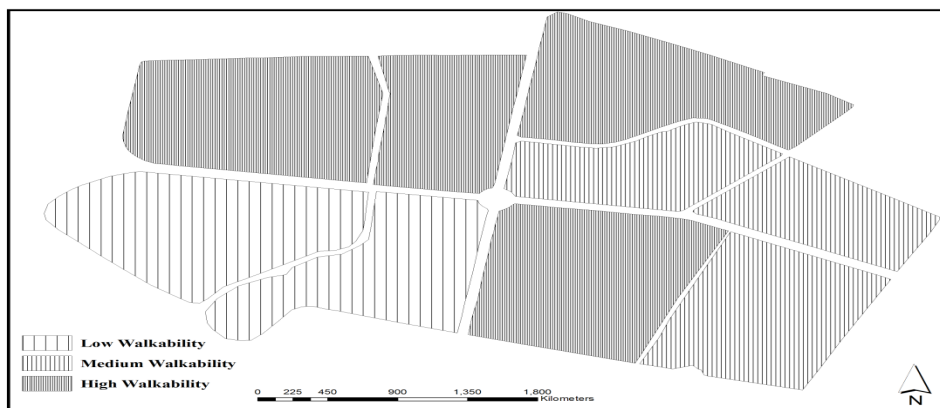
نقشه ۲: سطوح قابلیت پیاده‌روی در محلات شهر قروه