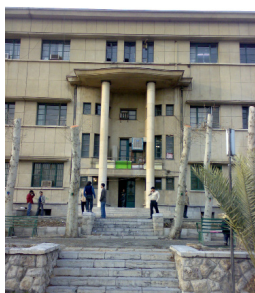
شکل ۱: دانشگاه تهران از آثار شاخص معماری معاصر ایران

راهبرد اصلی پژوهش استدلال منطقی و روش تحقیق، توصیفی-تحلیلی است. از تکنیک امتیازدهی متخصصین برای سنجش آثار بهره گرفته شده است. نمونه‌ها نیز به صورت هدفمند، متکی بر روش گلوله برفی انتخاب شده، بر اساس روش گروه بحث امتیازدهی شده‌اند. برای انجام مراحل تحقیق از الگوی گلوله برفی برای انتخاب نمونه‌ها استفاده شد. در آغاز کار به پنج نفر از معماران مشهور تهران مراجعه شده، از ایشان خواسته شد بناهای مطرحی که در بازه زمانی یک صد سال اخیر می‌شناسند، نام ببرند. علاوه بر آن که خواسته شد که اندیشمندان و معماران سرشناس و یا قابل توجه دیگر که می‌توانند در این راستا راهنمایی کنند را معرفی نمایند. کار تا جایی ادامه یافت که به «اشیاع نظری» رسید. برای رسیدن به این درجه، با ۱۰۸ نفر از افراد مطلع که به صورت زنجیره‌ای و با توجه به الگوی گلوله برفی انتخاب شده بودند، مصاحبه عمیق صورت پذیرفت. بر اساس برآیند ۲۰۴ بنا شناسایی شده و بر اساس تعداد رای، مرتب شدند. برای سهولت انجام تحقیق، ۲۰۰ نمونه اول برای تصمیم‌گیری انتخاب شدند. سپس بر اساس الگوی گروه بحث، به این بناها امتیاز داده شد؛ که پانزده بنا از آثاری که بیشترین امتیاز را کسب کردند، به عنوان نمونه در تحقیق ارائه شده‌اند.