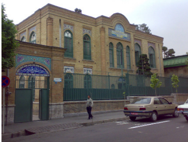
شکل ۷: دبیرستان فیروز بهرام، تهران