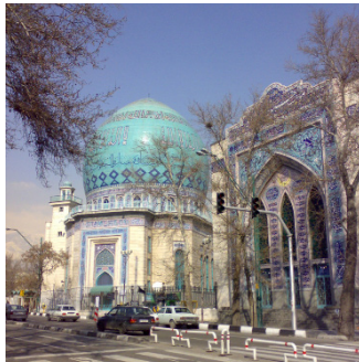
شکل ۶: حسینیه ارشاد، تهران