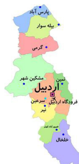
شکل ۳: نقشه شهری استان اردبیل

هدف طراحی تالار شهر اردبیل از یک سو ایجاد فضایی برای شورای شهر اردبیل و ارتباط بین مردم و دولت و از سوی دیگر جبران کمبود فضاهای فرهنگی در شهرستان اردبیل و پاسخگویی به احتیاجات مردم در بهره‌مندی از فضاهای تفریحی، آموزشی و گذران اوقات فراغت در فضایی مناسب و از طرف دیگر ساماندهی محدوده‌ای از بافت شهری می‌باشد که دچار اختلافات شهری و کمبود