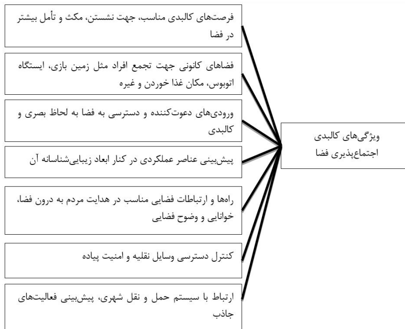
شکل ۱: ویژگی‌های کالبدی اجتماع‌پذیری فضا

فضاهای اجتماع‌پذیر که سبب افزایش هیجان و سرزندگی محیط و دعوت عابرین به این فضاها و فراهم نمودن امکان استراحت، تجارب خوشایند و سلامت بیشتر برای مردم می‌گردند نیز در این میان بسیار حائز اهمیت‌اند. عناصری چون: پادمان‌ها، پله‌ها، آبنماها و سایر عوامل مؤثر در تشویق انسان‌ها به حضور و تعامل در فضا در زمره عوامل تأثیرگذار در ارتقاء جنبه‌های کالبدی فضاهای عمومی محسوب می‌شوند. کیفیات طراحی‌های چون: تعیین و یکپارچگی