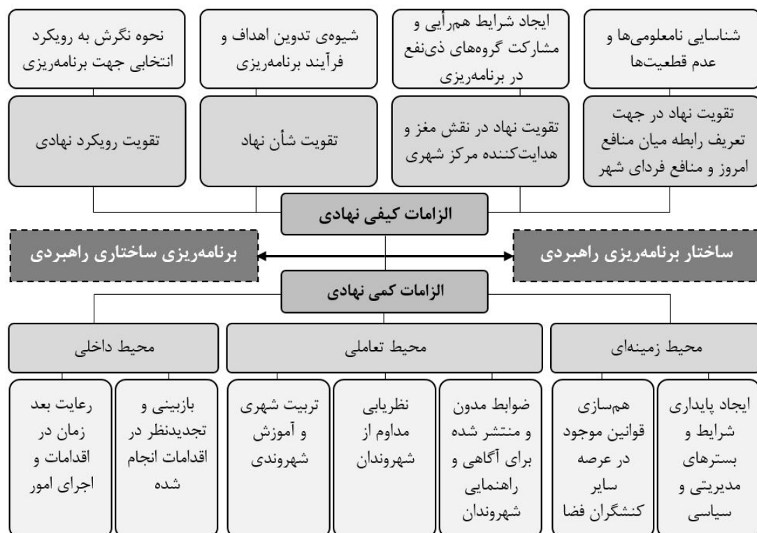
شکل ۳: مدل مفهومی در نظر گرفته شده توسط نگارندگان برای دستیابی به هدف پژوهش