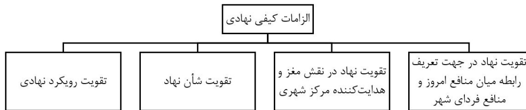
شکل ۱: الزامات کیفی نهادی برنامه‌های توسعه مبتنی بر ره‌یافت راهبردی

تدوین برنامه‌ی عمل به اجرای امور می‌پردازد (Tool, 1977).