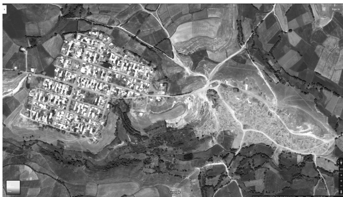
شکل ۲: عکس هوایی روستای کنزق، محل روستای قدیم و جدید

روستای کنزق از توابع بخش سرعین شهرستان اردبیل است (شکل ۲). این روستا از شمال به اراضی اردی‌موسی، از جنوب به روستای تاریخی کلخوران، از شرق به روستای آق‌قلعه و از غرب به شهر توریستی سرعین محدود شده است. ارتفاع این روستا از سطح دریا ۱۵۵۰ متر است.