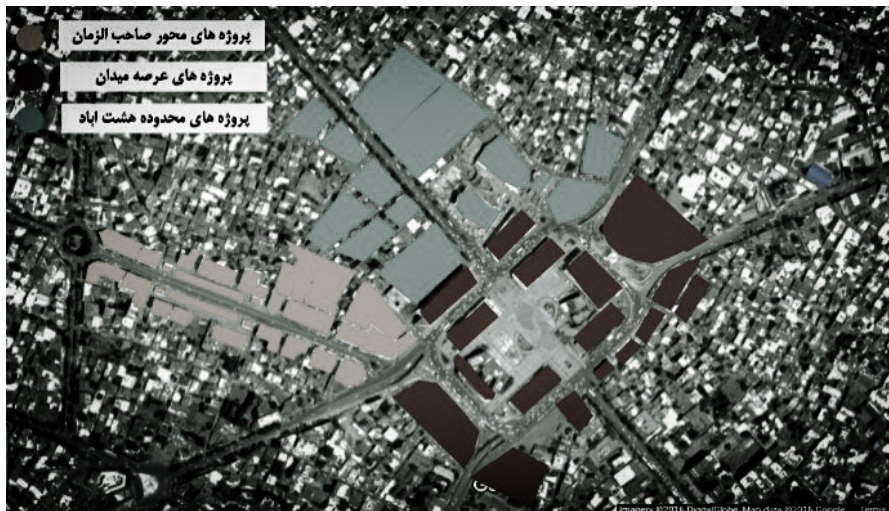
شکل ۱: محدوده‌ی پروژه‌های طرح بزرگ میدان شهدا

شمسی تبیین شده است. عوامل موثر در نوسازی محدوده با بهره‌گیری از اسناد و شواهد موجود، طرح پیشنهادی در سال ۱۳۸۳ (مهندسين مشاور طاش)، بازنگری آن در سال ۱۳۸۹ (مهندسين مشاور باوند) و مصاحبه هدفمند با افراد منتخب، شناسایی شده است که شرح فرایند آن در روش تحقیق آورده شده است. به دلیل رعایت اخلاق پژوهش و عدم رضایت مصاحبه‌شوندگان از آشکار شدن هویت آنان، از شماره‌گذاری برای مشخص کردن مصاحبه‌های صورت‌گرفته استفاده شده است. به دور از هرگونه پیش‌داوری توسط نویسندگان، ارتباط بین پاسخ‌های مصاحبه‌شوندگان، استنباطات از اسناد و شواهد و یافته‌های نظری مطالعه مبنای کار بوده است.