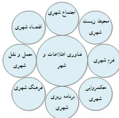
نمودار ۱: تأثیر فناوری اطلاعات بر ابعاد مختلف شهر

عصر فناوری اطلاعات و ارتباطات عصری است که در آن کیفیت زندگی، گستره دگرگونی اجتماعی و توسعه اقتصادی به گونه‌ای روزافزون به اطلاعات و بهره‌وری از آن متکی است (Sarafrazi & Memarzade, 2009, p. 8). در ادبیات شهرسازی دهه‌های اخیر، تأثیر متقابل فناوری اطلاعات و شهر و زمینه‌های پیدایش آن در نظام شهری تحت عنوان شهر الکترونیک بررسی شده است (Mitra & Schwartz, 1999, p. 30). شهر الکترونیک به مفهوم استفاده آسان از فناوری اطلاعات به‌منظور توزیع خدمات شهری به‌صورت مستقیم و شبانه‌روزی به شهروندان است (Jalali, 2003, p. 45). به‌طور کلی، می‌توان گفت که زمینه‌های اقتصاد شهری، روابط اجتماعی شهری، حمل‌ونقل شهری، فرهنگ شهری، محیط‌زیست شهری، فرم فیزیکی شهری، برنامه‌ریزی شهری و در نهایت مدیریت و حکمروایی شهری در ارتباط شهر و فناوری اطلاعات و ارتباطات قابل شناسایی است که در نمودار زیر بیان شده است: