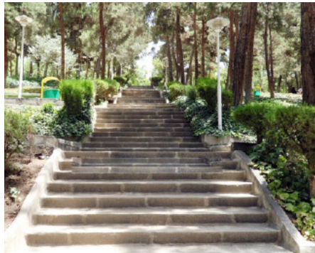
شکل ۲: گود بودن پارک ساعی

می‌باشد و از میان آن‌ها می‌توان به چنار، کاج تهران، سرو شیرازی، سرو نقره‌ای، سرو بادبزی، سرو تبر، برگ‌بو، افرا، نارون، سدروس، ماگنولیا، یاس وحشی، ژنیگو، زالزالک، گردو و سیب اشاره کرد. در طراحی این پارک تلاش شده که بیشتر حرکت‌های موجود، اسلیمی باشند تا یک نوع اختلاف سطح به وجود بیاید و از پله تا حد ممکن استفاده نشود.