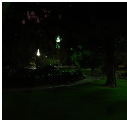
شکل ۳: نورپردازی نامناسب در شب در پارک ساعی

بر اساس مشاهدات و مصاحبه‌های انجام شده، به نظر می‌رسد که گود بودن پارک (پایین بودن سطح آن از خیابان) و متراکم بودن پوشش گیاهی در قسمت‌هایی از پارک باعث القای حس عدم امنیت می‌شود. به همین دلیل قسمتهایی از پارک به دلیل نداشتن نفوذ بصری و نظارت اجتماعی کمتر مورد استفاده قرار می‌گیرد و نورپردازی نامناسب مزید بر علت شده است. در نوبت صبح و شب به پارک رجوع شده است و هنگام تاریکی هوا (حتی در ساعت ۶ بعدازظهر) پارک خالی از جمعیت می‌شود. نورپردازی نامناسب باعث کاهش امنیت و نهایتاً کم‌رنگ شدن حضور زنان در پارک ساعی شده است.