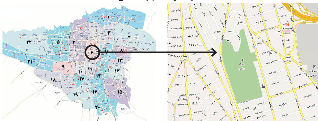
شکل ۱: موقعیت پارک ساعی

وسعت بوستان ساعی ۱۲۰۰۸۲ مترمربع و دارای شش ورودی است. در پی توسعه و تجهیز بوستان، بناهایی مانند جوی، برکه، آبشار و زمین بازی درست‌شده‌اند و قسمتی از پارک نیز به باغ ژاپنی معروف است که پرندگان آبی هم در آن قسمت نگه‌داری می‌شوند. در قسمت حیات‌وحش پارک، حیوانات دیگری نیز نگه‌داری می‌شوند که از جمله آن‌ها می‌توان به خرگوش، قوچ، غاز، قو، مرغابی، سنجاب، طوطی وحشی و طاووس اشاره نمود. پوشش گیاهی پارک نیز بسیار متنوع