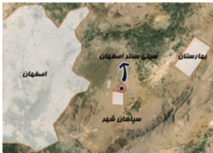
شکل ۳: موقعیت سیتی سنتر

مجموعه تجاری، تفریحی و توریستی سیتی سنتر اصفهان، در مجاورت اتوبان شهید دستجردی، روبروی ورودی جنوبی سپاهان-شهر واقع است. این مرکز باهدف ایجاد تسهیلات و امکانات لازم به‌منظور تأمین نیازهای روزمره شهروندان در زیر یک سقف و در هفت طبقه ساخته شده و شامل مرکز خرید، مجموعه سینمایی، سالن چندمنظوره، سالن‌های مختلف، شهربازی و پارکینگ است (شکل ۳).