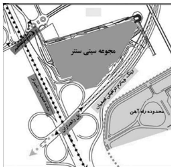
شکل ۵: موقعیت مجموعه سیتی سنتر

با توجه به محل قرارگیری سیتی سنتر اصفهان در مجاورت جاده اصفهان- شیراز امکان دسترسی به فضا تنها در یک جهت اصلی و از طریق حرکت سواره میسر است. از سوی دیگر به علت فاصله آن از شهر اصفهان و نقش عملکردی رینگ چهارم ترافیکی اصفهان و جاده اصفهان - شیراز، فضا به هیچ عنوان از حرکت عابران پیاده و دوچرخه سواران پشتیبانی نمی کند. در حال حاضر دسترسی اصلی از پارکینگ مجموعه است که در آن آستانه، به شکلی فعال و نمادین با ایجاد گیت های ورودی میسر شده است. با توجه به توضیحات فوق سیتی سنتر در پیکره فضایی از کمترین شرایط عمومیت برخوردار است و امتیاز ۱ بدان تعلق می گیرد.