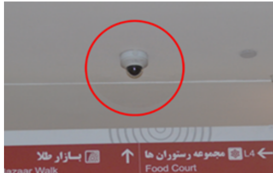
شکل ۴: استفاده از شیوه های کنترل سخت در مجموعه سیتی سنتر

در سراسر فضا به وضوح شاهد استفاده از رویکرد کنترل سخت هستیم. دوربین های نظارتی آشکارا در سراسر سایت به تعداد زیاد وجود دارند و نیروهای امنیتی خصوصی نیز در فواصل منظم از یکدیگر، فضا را تحت نظارت خود دارند. علایمی مبنی بر ممنوعیت برخی از فعالیتها در فضا نیز وجود دارد. باتوجه به جدول ۱، مجموعه پایینترین میزان عمومیت در این مولفه را به خود اختصاص می دهد.