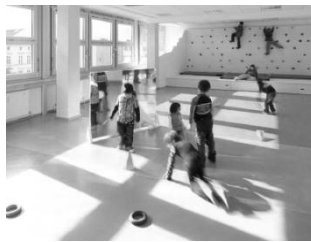
شکل ۳: مهد کودک در برلین

حضور نور طبیعی در فضای بازی کودکان (Wang & Wang, 2013)