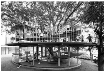
شکل ۴: مهد کودک فوجی ۱۲

استفاده از طبیعت و مصالح طبیعی در فضای بازی کودکان (Galindo, 2011)