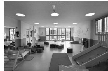
شکل ۲: مهد کودک در زاراوتز ۱۱

انعطاف‌پذیری فضا به دلیل وجود دیوارها و مبلمان قابل‌تحرك توسط کودکان (Hi design, 2013)