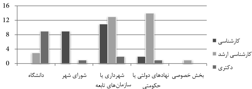
نمودار ۱: توزیع فراوانی میزان تحصیلات بر حسب سازمان محل خدمت

همچنین ۱۵/۶٪ از شرکت کنندگان تحقیق حاضر عضو هیأت علمی، ۲۱/۹٪ مدیر ارشد، ۵۷/۸٪ مدیر اجرایی و ۳/۱٪ دانشجوی تحصیلات تکمیلی هستند. در ضمن ۱/۶٪ کل مجموع پاسخ دهندگان در مورد سمت سازمانی خود اطلاعاتی ارائه نداده اند. این اطلاعات نشان دهنده آن است که بیشتر پاسخ دهندگان پرسش نامه تحقیق کنونی مدیران اجرایی هستند. پس از آن مدیران ارشد بیشترین فراوانی را دارند، به طوری که داده های تحلیل بر روی سمت سازمانی شرکت کنندگان آشکار می سازد که مد پاسخ دهندگان تحقیق کنونی مدیران اجرایی هستند. از آنجایی که مدیران اجرایی به طور ملموس تری با مشکلات و چالش های مدیریت شهری مواجه اند، نتایج به دست آمده از اطلاعات و دیدگاه های این نمونه به واقعیت نزدیک تر خواهد بود. همچنین ۱۸/۸٪ از شرکت کنندگان تحقیق حاضر در دانشگاه مشغول به فعالیت هستند، ۱۰/۹٪ در شورای شهر، ۴۰/۶٪ در شهرداری یا سازمان های تابعه، ۲۶/۶٪ در نهادهای دولتی یا حکومتی و ۱/۶٪ نیز در بخش خصوصی فعالیت می کنند. در ضمن ۱/۶٪ کل مجموع پاسخ دهندگان در مورد سازمان محل خدمت خود اطلاعاتی ارائه نداده اند (نمودار ۱).