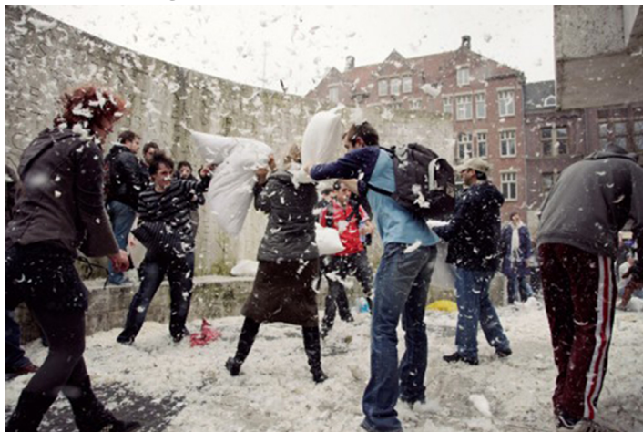
(Pillow Fight Day, 2009)