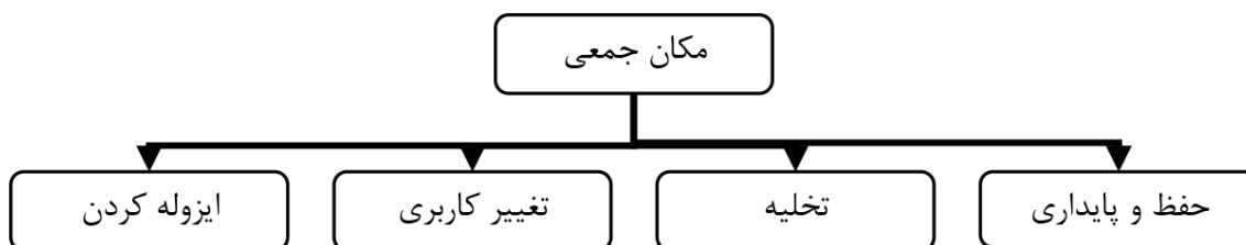
شکل ۲: انواع برخورد با یک مکان جمعی در هنگام تهدید