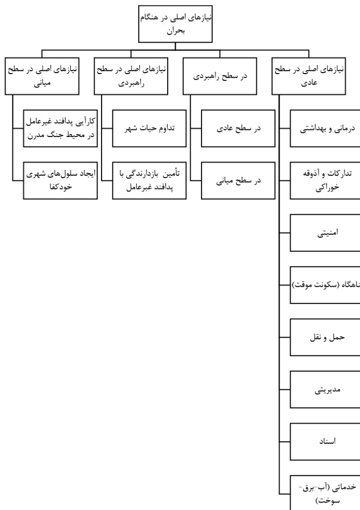
شکل ۳: نیازهای اصلی در هنگام بحران در سطوح مختلف

پایداری نقاط راهبردی و یافتن راه‌حلهایی برای حفظ کالبد و عملکرد از نتایج شناسایی و اولویت بندی اماکن به‌شمار می‌رود. با لحاظ کردن چهار نوع برخورد با یک مکان جمعی در هنگام تهدید و انواع اقداماتی که در خصوص معماری پدافند غیرعامل آن‌ها صورت می‌پذیرد، می‌توان چنین نتیجه گرفت: در اماکنی که اولویت اول حمله هستند، باید راهبردها و رهنمودها معطوف به تخلیه باشد؛ یعنی دسترسی برای خروج افراد، خوانا و مناسب جمعیت طراحی شود. در گزینه‌هایی که برای تغییر کاربری مناسب هستند، باید سعی در استحکام بخشی و تقویت بنا صورت گیرد و ایده‌ها معطوف به افزایش پایداری این اماکن باشد.