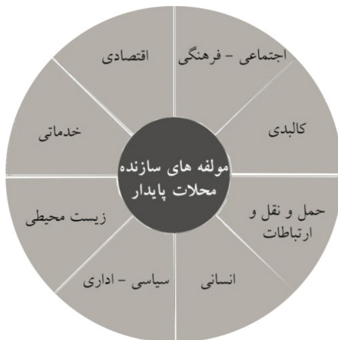
شکل ۲: مؤلفه‌های سازنده محله‌های پایدار

با توجه به آنچه به آن پرداخته شد و شناخت مؤلفه‌های سازنده محله‌های پایدار می‌توان یک محله پایدار را این‌چنین تعریف کرد: