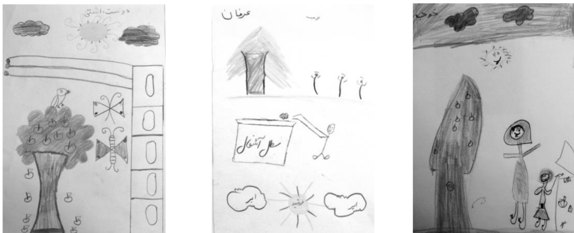
تصویر ۱: نمونه‌هایی از نقاشی کودکان در نمونه مطالعاتی بیانگر عوامل مطلوبیت فضا از نظر آنان

با توجه به روش‌های گوناگون اشاره‌شده توسط صاحب‌نظران در رابطه با مشارکت کودکان در طراحی فضاهای شهری و در جهت دستیابی به بهترین نتایج کاربردی، روشی ترکیبی مشتمل بر ثبت نقاشی‌های کودکان به همراه مصاحبه و مشاهده