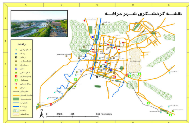
شکل ۲: نقشه و محدوده شهر مراغه

با توجه به پیشینه تحقیقات داخلی و خارجی در رابطه با گردشگری و توسعه آن همه تحقیقات به دنبال یافتن