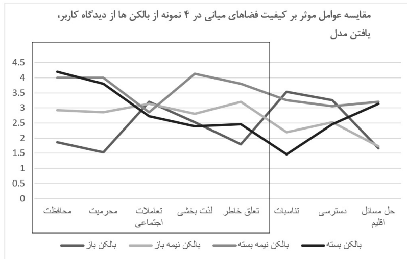
شکل ۱: مقایسه عوامل موثر بر کیفیت فضای میانی از دیدگاه ساکنان در نمونه‌های بررسی شده

این میزان تعاملات اجتماعی و ارتباط با محیط بیرون در تضاد با نیاز حریمیت و محافظت می‌باشد اما در بالکن‌ها با جداره منعطف و نیمه‌باز به دلیل توانایی کنترل نسبت خود و دیگری این مسئله اندکی بهبود یافته است. از طرف دیگر میزان لذت‌بخشی با علاقه به فضا و ایجاد حس تعلق خاطر نیز نسبت مستقیم دارد. حضور گیاهان و سرسبزی و مبلمان در بالکن نیز در مراتب بعدی حائز اهمیت هستند. بنابراین بسته به کالبد فضایی بالکن؛ تناسب آن و نوع ارتباط درون بیرون آن و حس تعلق ساکنان به آن، بالکن به عنوان فضایی بیرونی یا درونی در ذهن افراد تلقی می‌گردد.