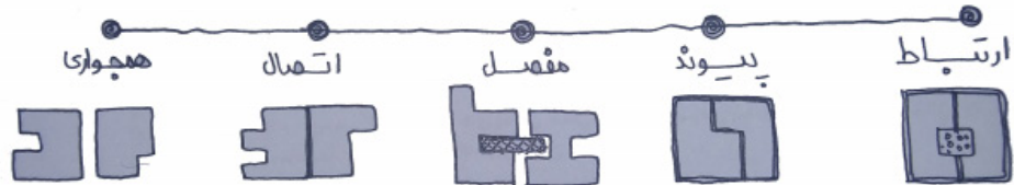
شکل ۳: الگوی درجه‌بندی فضای میانی از ضعیف تا قوی