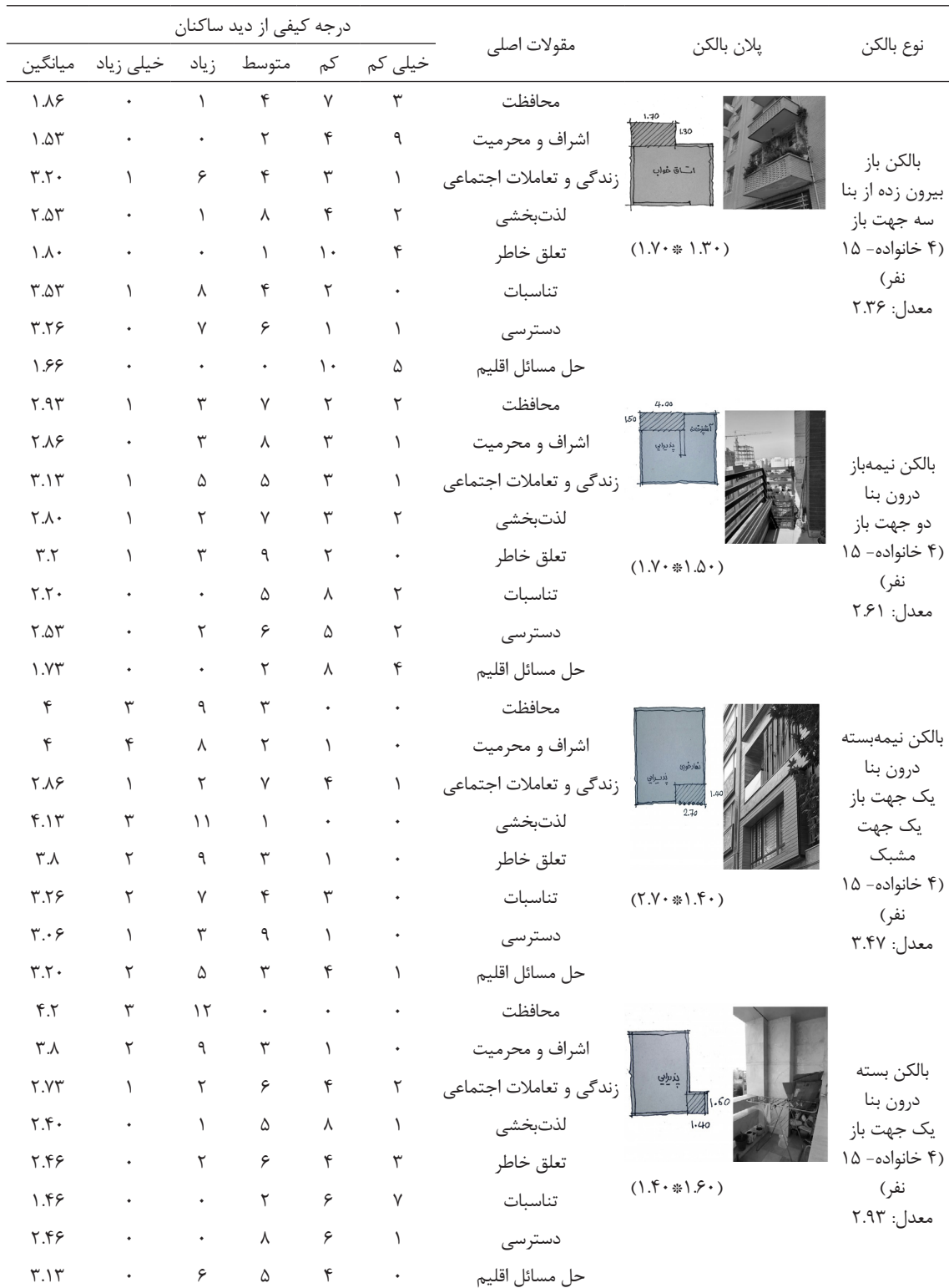
جدول ۴: درجه کیفی بالکن‌های مختلف بر اساس تحلیل پرسش‌نامه ساکنان ضمن اشاره به مقولات اصلی

سطح سرزندگی، استفاده و مطلوبیت میان ساکنان بودند.