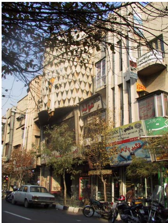
تصویر ۵: خالی شدن خیابان از محتوای اصلی خود سبب تغییر کارکردها و فعالیت‌ها بی به صورت ناهمخوان با هویت تاریخی آن ذکر شده است.

از طرفی در میدان امیرچخماق یزد ماهیت غالب فضای آن که کارکرد مذهبی و حکومتی آن بوده است تقریباً تا این زمان از بین رفته است ولی بخش‌هایی از خصوصیات و بافت‌های کالبدی آن تداوم یافته که این خود باعث ایجاد وضوح هویت کالبدی آن گردیده است. با این حال به لحاظ انطباق هویت موجود این میدان با هویت غالب تداوم یافته آن در مقایسه با میدان نقش جهان اصفهان درجه پایین‌تری از انطباق هویت تاریخی قابل مشاهده است. با توجه به مثال فوق در خصوص خیابان لاله زار تهران نیز همین تحلیل را می‌توان ارائه کرد. به این ترتیب که کارکرد غالب تفریحی و گردشگری این محور که ماهیت غالب آن بوده است از دوره‌ای به بعد کمرنگ شده و محتوای جدیدی به این فضا وارد شده است. تاجائی که هم اکنون فضای امروزی تقریباً تهی از ماهیت و محتوای تاریخی آن شده است تصویر شماره (۵).