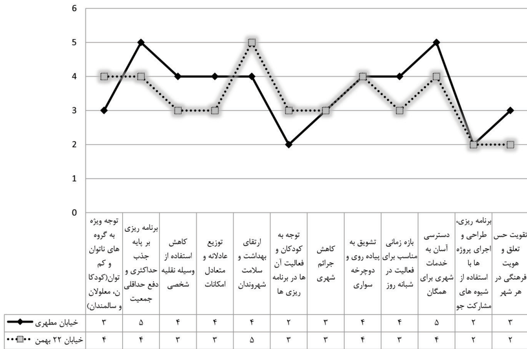
نمودار ۱: نمرات اکتسابی هر خیابان از شاخص‌های مد نظر مقاله

نتایج به دست آمده از پرسشنامه‌ها و نمودار ۱ را می‌توان این‌گونه بیان داشت: