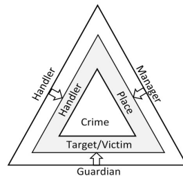
Fig. 1. Crime Triangle (Felson, 2008, p. 75)

Place, as a third phenomenon, requires a manager, or, in the view of urbanism, a planner or a designer to remove the context and potential for the occurrence of crime. Studies on the relationship of urban form and environmental design elements with crime occurrence are carried out to neutralize the third factor, i.e. place of crime, or in other words, to remove a side of the crime triangle.