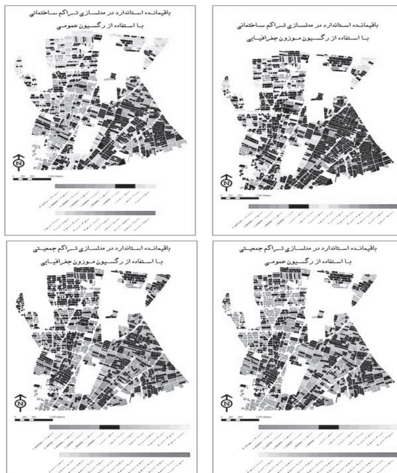
تصویر ۴: نقشه‌های مربوط به باقی‌مانده‌های استاندارد دو مدل OLS و GWR

نکته بسیار مهمی که در اینجا باید بدان اشاره نمود مقایسه تفاوت در نقشه باقی‌مانده‌های استاندارد حاصل از دو مدل رگرسیون معمولی و رگرسیون وزن دار فضائی است. در مقایسه این نقشه‌ها که به ترتیب زیر به صورت نقشه باقی‌مانده استاندارد در مدلسازی تراکم ساختمانی با استفاده از رگرسیون کلی، نقشه باقی‌مانده استاندارد در مدلسازی تراکم جمعیتی با استفاده از رگرسیون کلی، نقشه پیوست باقیمانده استاندارد در مدلسازی تراکم ساختمانی با استفاده از رگرسیون وزن دار فضائی، نقشه باقیمانده استاندارد در مدلسازی تراکم جمعیتی با استفاده از رگرسیون وزن دار فضائی نشان داده شده است. قسمت‌های تیره رنگ نشان دهنده باقیمانده صفر یا بسیار نزدیک به صفر است و همان‌طور که مشاهده می‌شود در نقشه خروجی حاصل از مدل رگرسیون وزن دار فضایی برای هر دو متغیر شاهد افزایش این رنگ که نشان دهنده خطای کمتر در مدل است، هستیم (تصویر ۴).