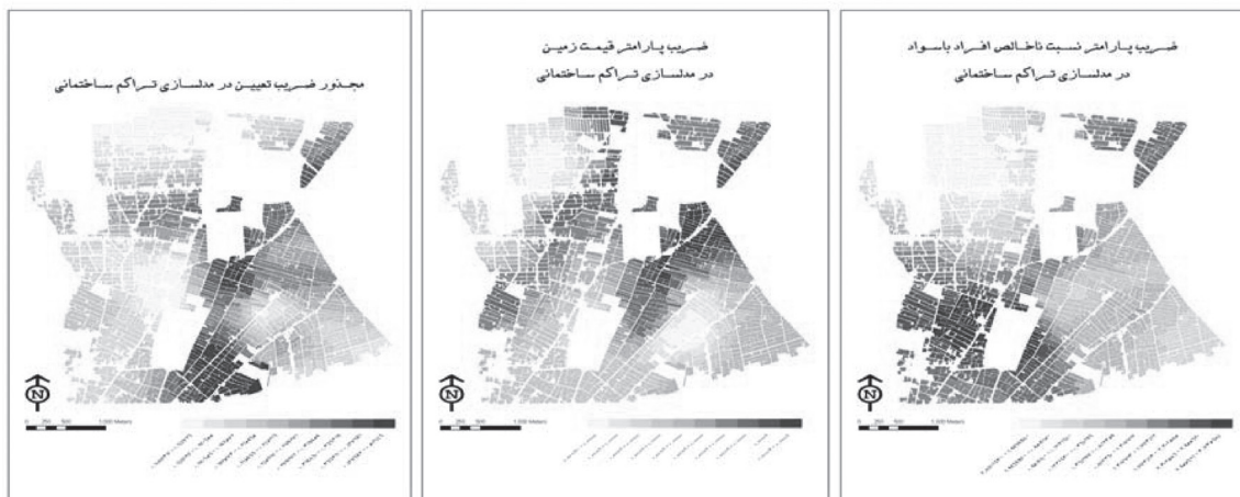
تصویر ۲: نقشه‌های خروجی حاصل از مدل GWR برای متغیر تراکم ساختمانی

چنانچه در نقشه‌های خروجی حاصل از مدل می‌توان دید ضرایب رگرسیون برای هر بلوک مشخص بوده و همین خصیصه رگرسیون وزن دار فضایی سبب کاهش خطا در برنامه‌ریزی‌های آینده است.