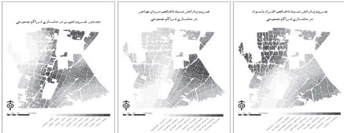
تصویر ۳: نقشه‌های خروجی حاصل از مدل GWR برای متغیر تراکم جمعیتی

نکته بسیار مهمی که در اینجا باید بدان اشاره نمود مقایسه تفاوت در نقشه باقی‌مانده‌های استاندارد حاصل از دو مدل رگرسیون معمولی و رگرسیون وزن دار فضائی است. در مقایسه این نقشه‌ها که به ترتیب زیر به صورت نقشه باقی‌مانده استاندارد در مدلسازی تراکم ساختمانی با استفاده از رگرسیون کلی، نقشه باقی‌مانده استاندارد در مدلسازی تراکم جمعیتی با استفاده از رگرسیون کلی، نقشه پیوست باقیمانده استاندارد در مدلسازی تراکم ساختمانی با استفاده از رگرسیون وزن دار فضائی، نقشه باقیمانده استاندارد در مدلسازی تراکم جمعیتی با استفاده از رگرسیون وزن دار فضائی نشان داده شده است. قسمت‌های تیره رنگ نشان دهنده باقیمانده صفر یا بسیار نزدیک به صفر است و همان‌طور که مشاهده می‌شود در نقشه خروجی حاصل از مدل رگرسیون وزن دار فضایی برای هر دو متغیر شاهد افزایش این رنگ که نشان دهنده خطای کمتر در مدل است، هستیم (تصویر ۴).