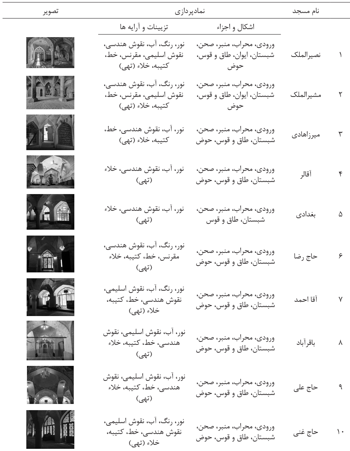
جدول ۶: نمونه‌های مورد پژوهش

پیش رو، ضمن تلاش و تعقل، به خداوند توکل می‌کنند، آرامش و امنیت محکم و وصف‌ناپذیری را تجربه می‌کنند. ۴. معرفی نمونه‌های مورد پژوهش نمونه‌های مورد پژوهش، از مساجد تاریخی دوره قاجاریه را معرفی می‌نماید.