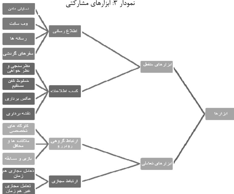
نمودار ۳: ابزارهای مشارکتی